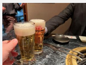
命の洗濯は、定期的に必要なですね…乾杯！

というわけで、今回は久しぶりに会社からやや近場となる赤穂市内のお店をご紹介します。よく通っていたにもかかわらず、紹介が漏れていたとは…まさに盲点でした。