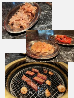
バリッと焼いた鶏皮、カルビもコストバ抜群。軽くつまむには、正直もったいないクオリティです。

そして鍋と言えばメですよね。唐唐鍋では、うどん、中華そば、雑炊、チーズリゾットから選べるのですが、私はこの辛い系鍋では断然チーズリゾット派。この日も選んでしまいました。贅沢にもウインナーも追加投入。辛さとチーズのまろやかさが絡み合い、最高の一皿となりました。