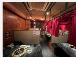
テーブル席や座敷席など、席も充実しています

JR播州赤穂駅からだと徒歩11分程度と赤穂飲食店街からは少しだけ離れますが、赤穂城跡にほど近い場所にあるお店です。